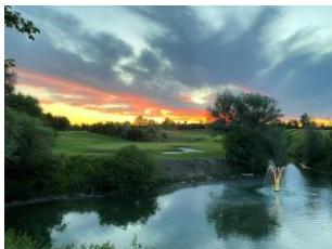
Sonnenuntergang im Golfpark: die neue Wasserfontäne an Loch 15