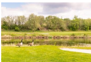
Tiere fühlen sich im Golfpark Aschheim besonders wohl.