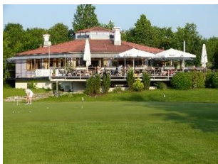
Beliebt bei Golfern und Nicht-Golfern: Die Sonnenterrasse des Clubhauses im Golfpark Aschheim.