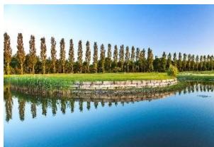
Das legendäre Inselgrün.